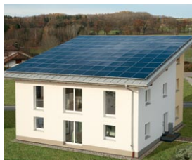
Bateria słoneczna z modułów fotowoltaicznych Vitovolt

Instalacja systemu fotowoltaicznego nie jest skomplikowana. 10 m 2 paneli słonecznych wystarcza do pokrycia średniego zużycia energii elektrycznej mieszkańca Polski.