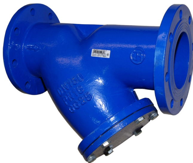
Na zdjęciu DN150